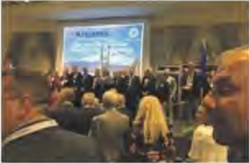
La riunione del Kiwanis che si è svolta a Viagrande è stata ricca di contenuti e di messaggi di impegno e di speranza