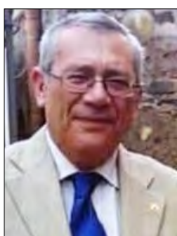
Giovanni Vecchio Catania Centro