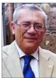
Giovanni Vecchio Catania Centro