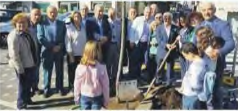
La messa a dimora dell'albero nella piazza di Trecastagni