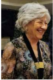
Mela Albana Acicastello R.C.