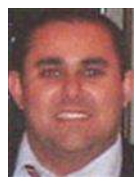
Liborio Palazzo Terre di Aci