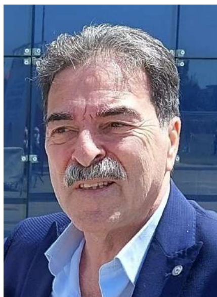
LGT Governatore Elettto Angelo Corsaro